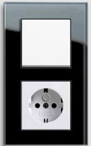
Gira Standard 55