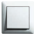
Bianco puro satinato (simile a RAL 9010)