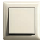
Bianco crema brillante (simile a RAL 1013)