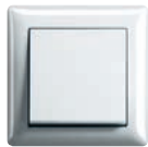
Bianco puro brillante (simile a RAL 9010)