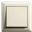
Bianco crema brillante (simile a RAL 1013)