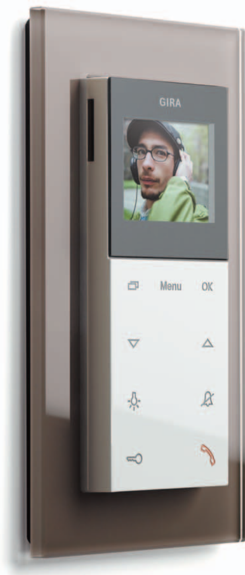
Gira Wideounifon natynkowy, Gira Esprit, szkło umbra/biały z polyskiem

Nowość. Gira Esprit, Szkło umbra Program stylistyczny Esprit zawiera ponad 230 urządzeń do wyposażenia inteligentnego budynku.