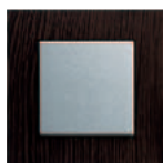
drewno wenge/ kolor aluminium