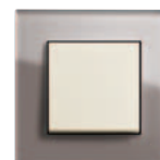
Nowość. szkło koloru umbry/ kremowy z połyskiem