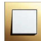
mosiądz/ biały z połyskiem