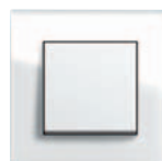
białe szkło/ biały z połyskiem