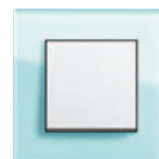
seledynowe szkło/ biały z połyskiem