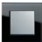
czarne szkło/ kolor aluminium