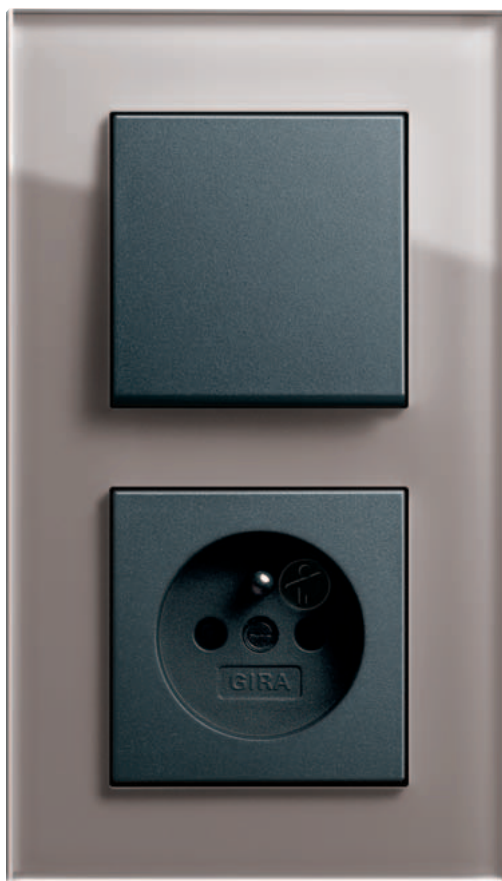
Gira Esprit, Zestaw podwójny – wyłącznik i gniazdo wtyczkowe, szkło umbra/antracyt